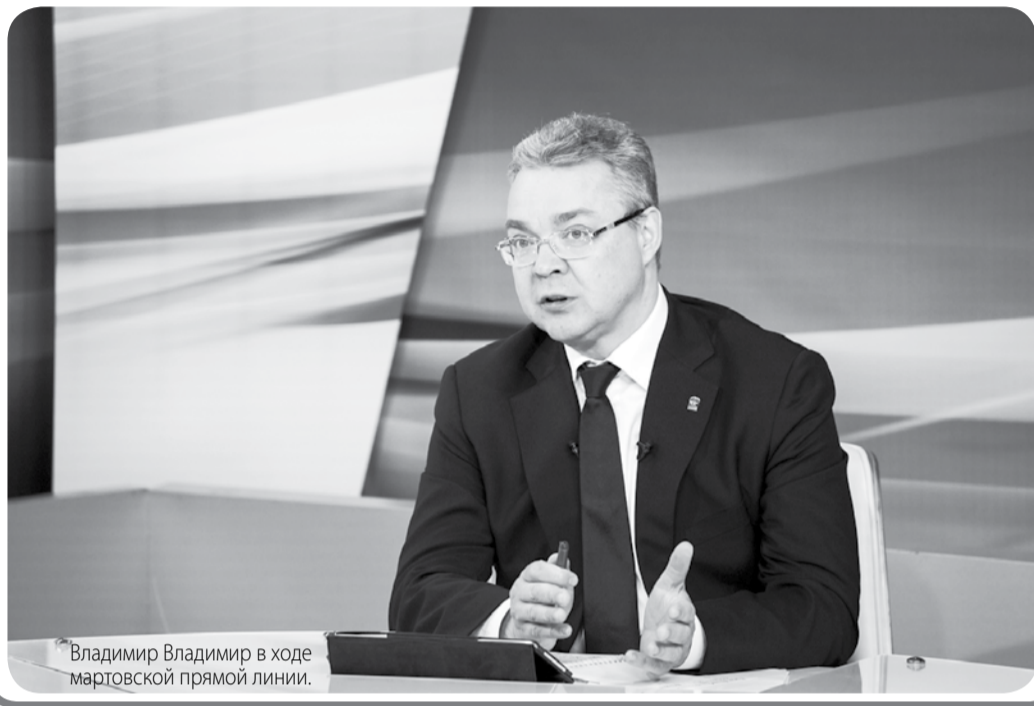
Владимир Владимиров в ходе мартовской прямой линии.

27 марта состоялась первая в этом году прямая линия губернатора Ставрополья Владимира Владимиров, в ходе которой глава региона отвечал на вопросы жителей края. Были затронуты темы поддержки ставропольцев – участников СВО и их семей, развития отрасли здравоохранения, ЖКХ, ремонта дорог.